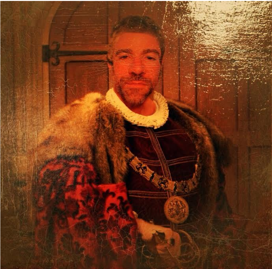
Jean-Pastis II, père du catalcoolisme et de la grande pacification

On devient catalcoolique dès que l’on est en âge de dire « J’ai soif », ce qui fait économiser les frais de baptême et enrichi davantage les commerces duty free de la Jonquera à la frontière espagnole. La Jonquera lieu de pèlerinage que tout aigues-mortais se doit de faire au moins une fois dans sa vie pour repousser la « cirrhose » (ou « Satan » chez les chrétiens) selon la superstition sacrée.