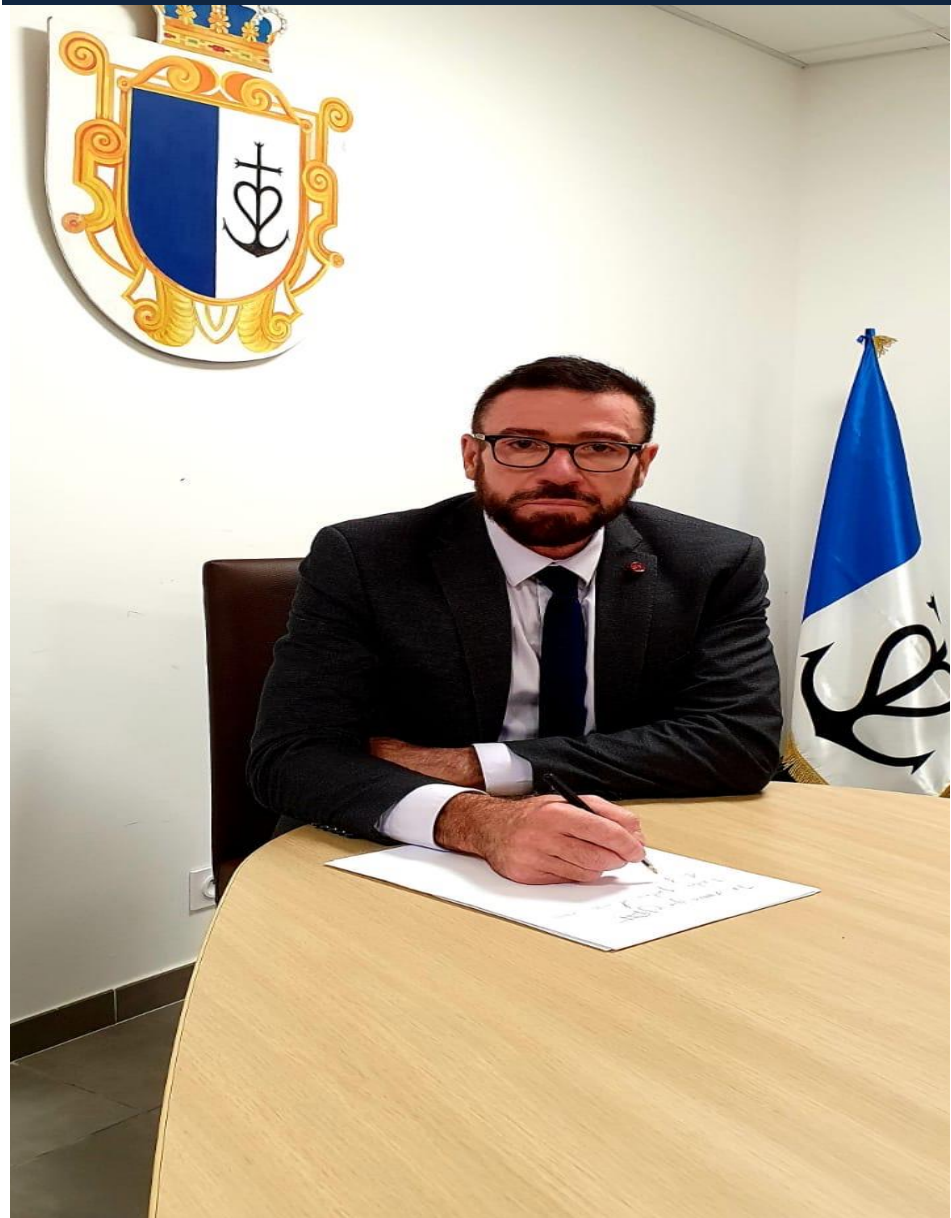
SAS le Prince Jean-Pierre IV travaillant son texte

Il y a ici une réelle dimension de chef d’état dans laquelle il se montre fédérateur et protecteur en utilisant « une recette toute simple ». Ce soir-là, Jean-Pierre IV nous parle. Il n’est pas devant nous pour nous convaincre mais pour nous dire qu’il sera présent pour veiller sur notre bonheur. On est dans une intention sincère bien plus que dans la démonstration du bien-fondé de la Principauté. On le sent là avec nous et pour nous. Sur les réseaux sociaux, un très grand nombre de messages de sympathie ont suivi ses vœux qui marquent sans contexte un tournant dans son règne. Le temps n’est plus à la démonstration, le respect n’est plus à gagner et les preuves de son immense travail ne se comptent plus. Place désormais à l’attention, au partage et à l’affection, le cœur encore touché par l’élan populaire dont il fût témoin pendant le week-end d’octobre rose. Évènement qu’il ne manque pas de citer dans son discours décidemment tourné vers le retour de la vie en rosé. Voici une partie du discours que vous pouvez voir sur RTAM.TV .